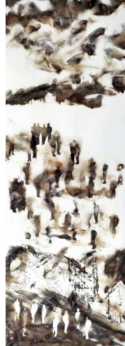
ΑΓΝΩΣΤΟ ΑΥΡΙΟ Ι Φωτιά σε χαρτί 70x28 εκ. 2023