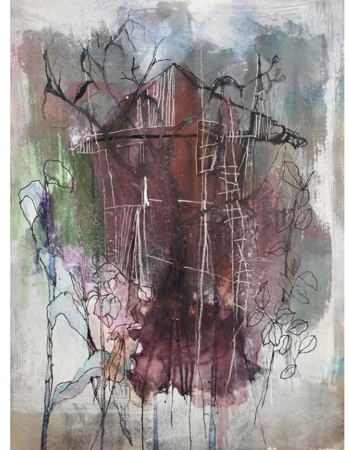
ΤΟ ΔΕΝΤΡΟ ΜΕ ΤΟ ΣΠΙΤΙ II Ακουαρέλα, μελάνι, πένακι 43x33 εκ. 2023