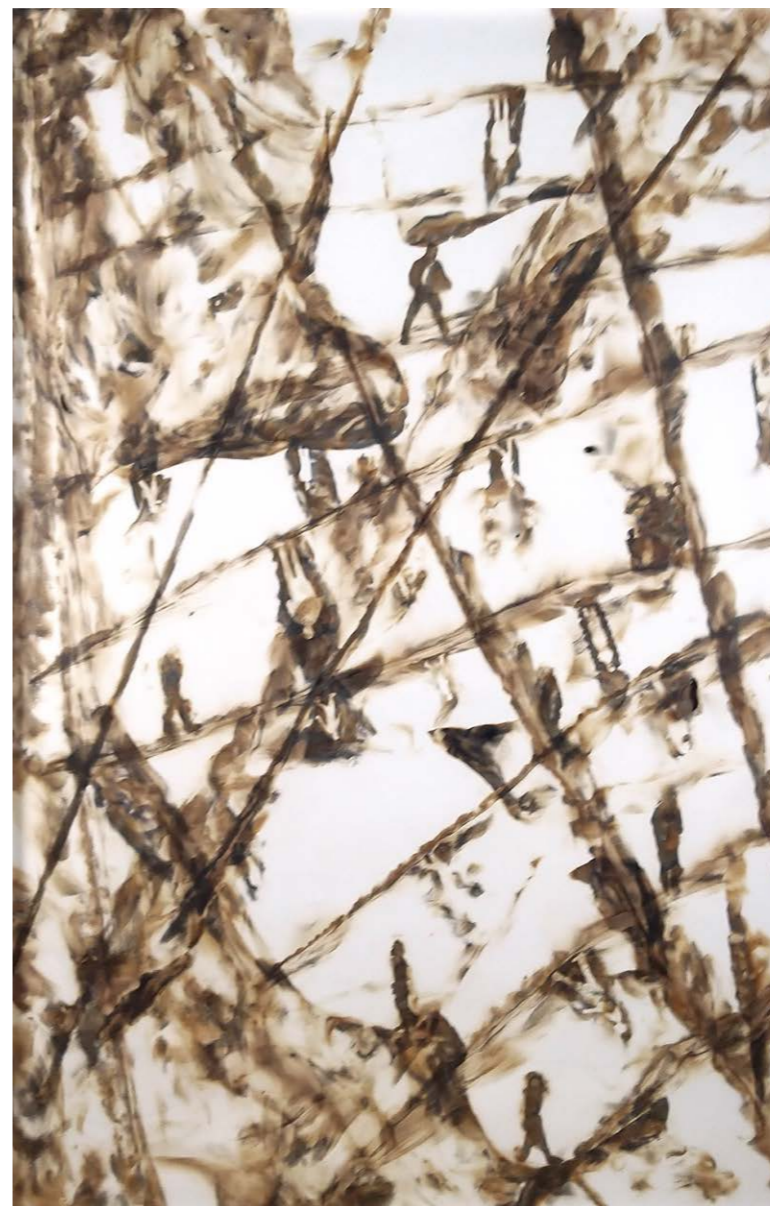
ΕΜΒΡΥΟ Φωτιά σε χαρτί 80x123 εκ. 2023