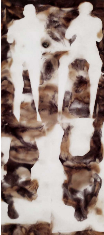
ΚΑΘΡΕΦΤΗΣ II Φωτιά σε χαρτί 55x32 εκ. 2021