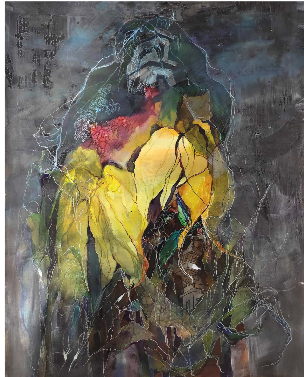
ΗΛΙΟΣ ΜΕΣΑ ΣΤΗ ΝΥΧΤΑ Ακουαρέλα, μελάνι, πένακι 65x50 εκ. 2022