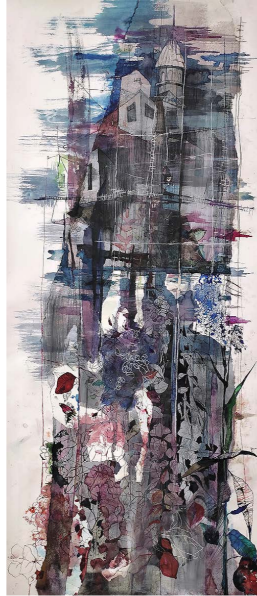
ΕΡΕΪΠΙΑ Ακουαρέλα, μελάνι, πενάκι, collage 150x65 εκ. / 2023