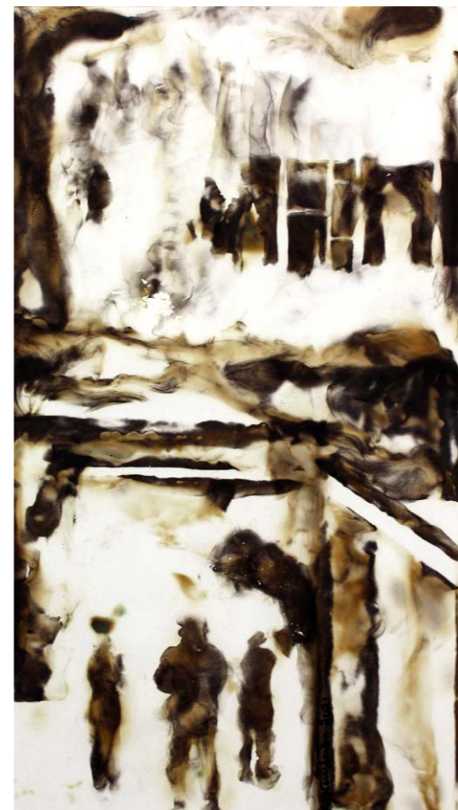
ΠΑΡΑΘΥΡΑ Φωτιά σε χαρτί 53x36 εκ. 2021