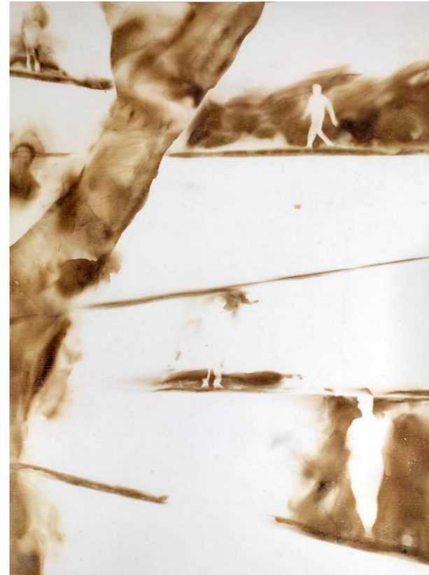
ΔΙΑΔΡΟΜΕΣ I Φωτιά σε χαρτί 43x33 εκ. 2023