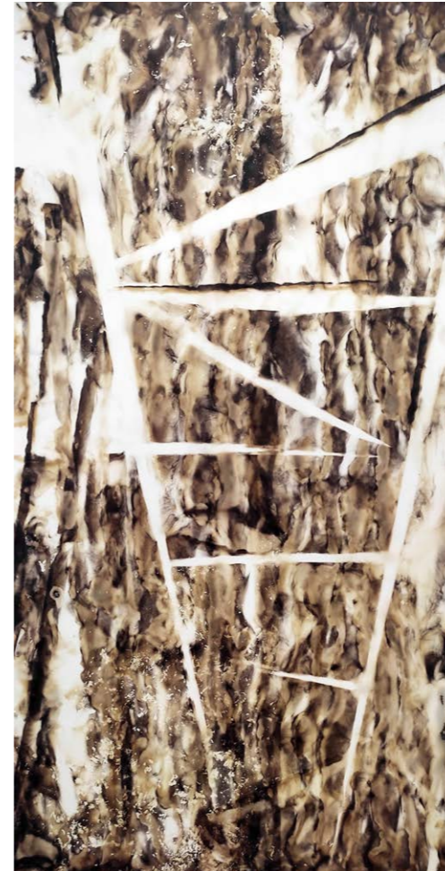
ΣΚΑΛΑ I Φωτιά σε χαρτί 70x36 εκ. 2021