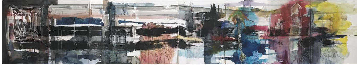
ΔΡΟΜΟΣ I Ακουαρέλα, μελάνι, πενάκι 32x145 εκ. 2020