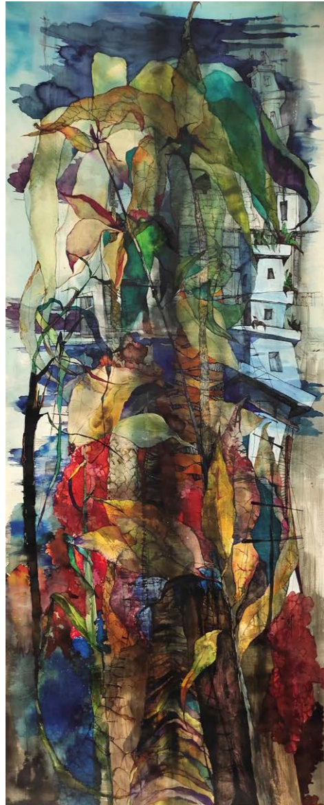
ΕΝΑΣ ΑΛΛΟΣ ΦΑΝΤΑΣΤΙΚΟΣ ΚΑΙΝΟΥΡΓΙΟΣ ΚΟΣΜΟΣ Ακουαρέλα, μελάνι, πενάκι 150x65 εκ. / 2023