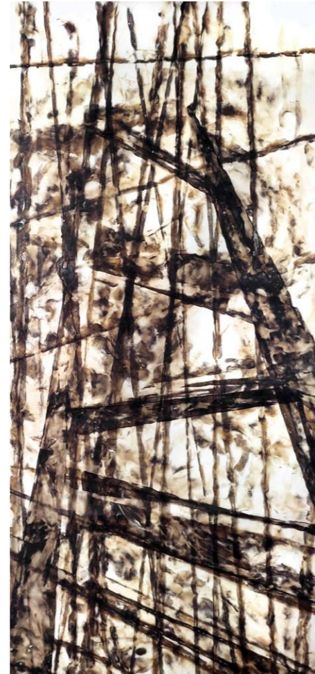
ΣΚΑΛΑ II Φωτιά σε χαρτί 124x61 εκ. 2021