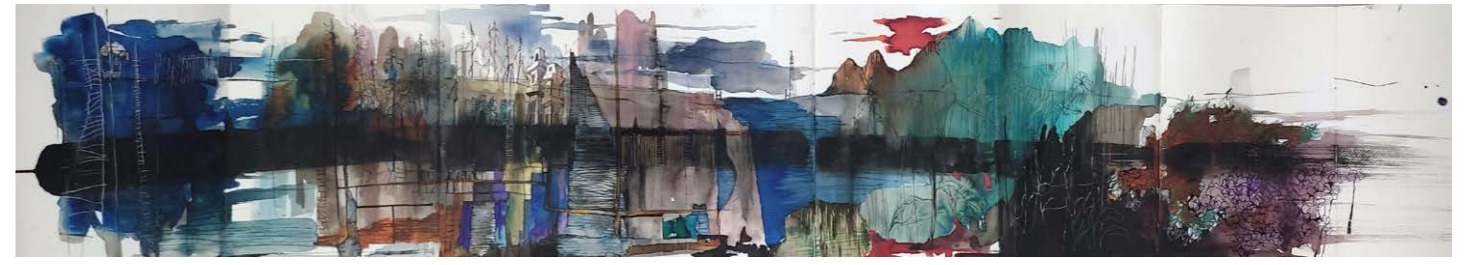
ΔΡΟΜΟΣ II Ακουαρέλα, μελάνι, πενάκι 37x180 εκ. 2023