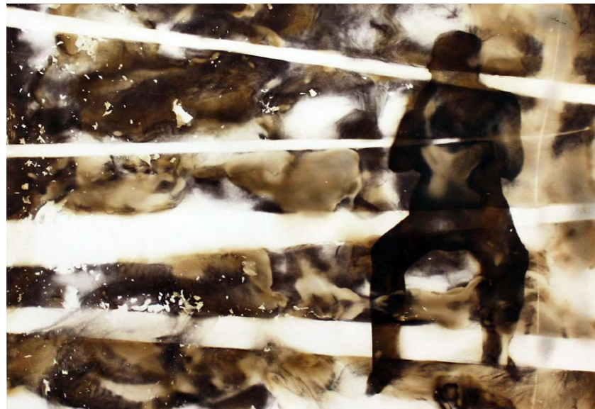
Ο ΔΡΟΜΟΣ ΣΟΥ ΕΙΣΑΙ ΕΣΥ Φωτιά σε χαρτί 35x41εκ. 2021