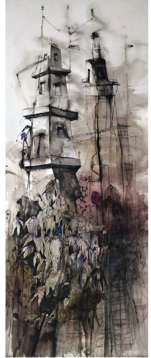
ΣΤΟ ΜΕΤΑΙΧΜΙΟ Ακουαρέλα, μελάνι, πενάκι 150x65 εκ. / 2023