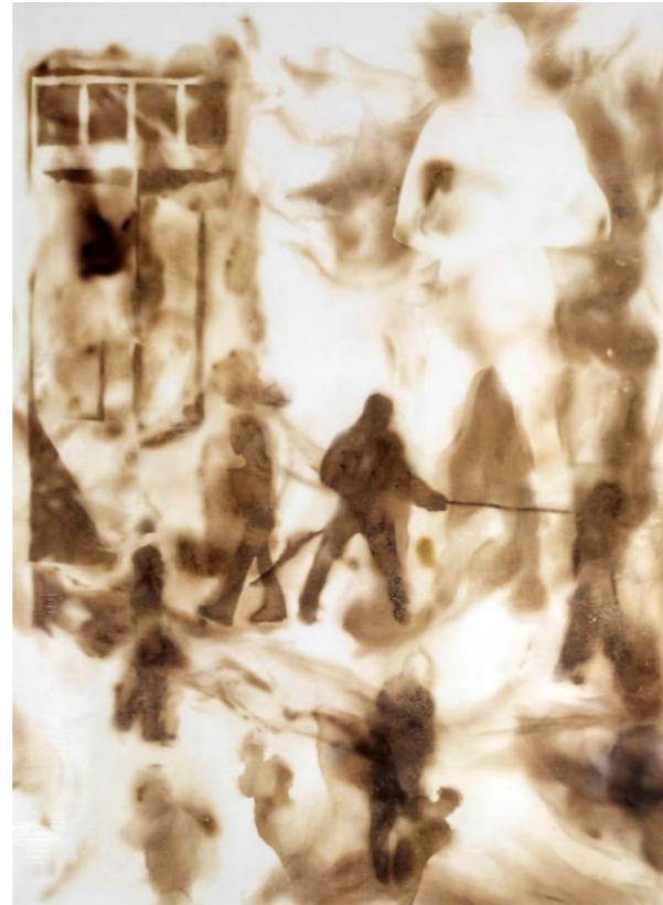
ΚΟΜΜΑΤΙ ΤΟΥ ΧΘΕΣ I Φωτιά σε χαρτί 43x33 εκ. 2023