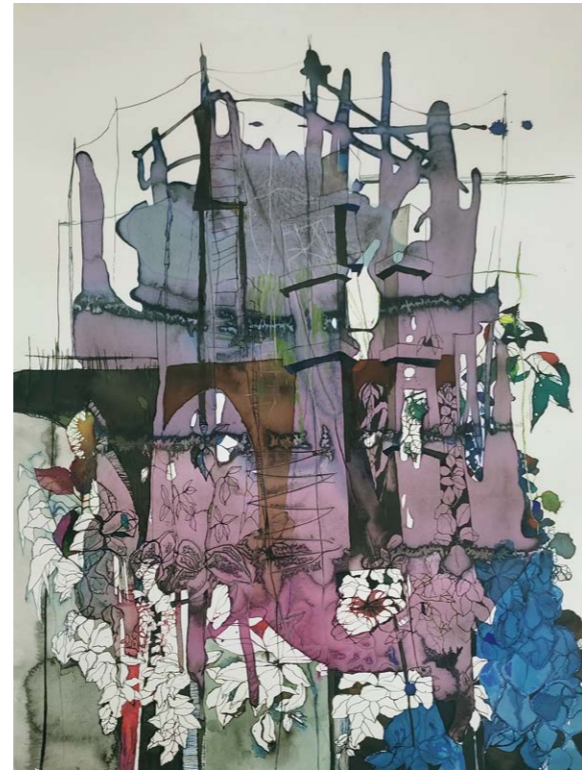
ΑΛΗ ΜΙΑ ΠΟΛΗ Ακουαρέλα, μελάνι, πενάκι 67x54εκ. 2023