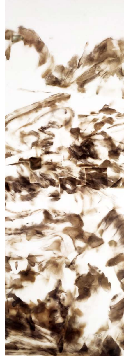
ΑΓΝΩΣΤΟ ΑΥΡΙΟ ΙΙΙ Φωτιά σε χαρτί 79x31 εκ. 2022