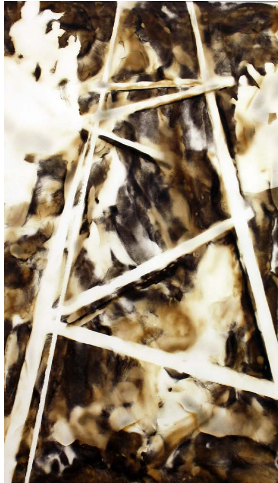
ΣΚΑΛΑ III Φωτιά σε χαρτί 51x37 εκ. 2021