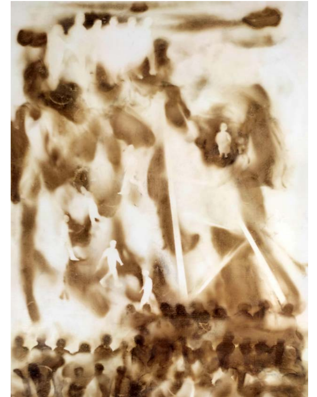
ΚΟΜΜΑΤΙ ΤΟΥ ΧΘΕΣ II Φωτιά σε χαρτί 43x33 εκ. 2023