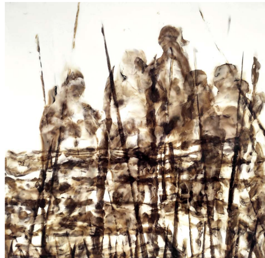
ΠΕΡΑ ΑΠΟ ΤΟΝ ΦΡΑΧΤΗ Φωτιά σε χαρτί 63x65 εκ. 2021