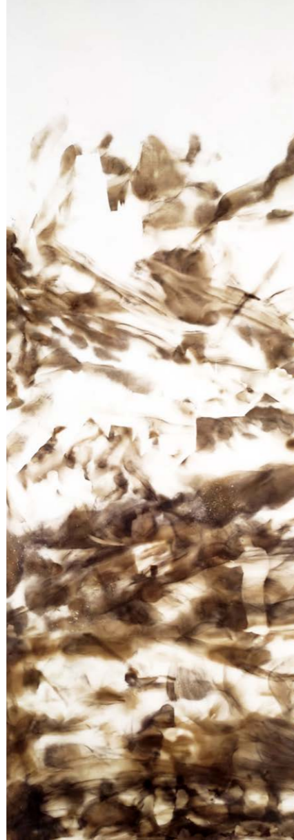
ΑΓΝΩΣΤΟ ΑΥΡΙΟ ΙΙΙ Φωτιά σε χαρτί 80x30 εκ. 2022