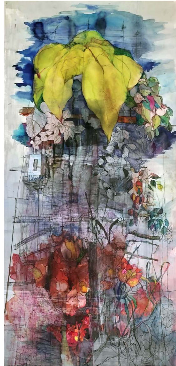
ΗΛΙΟΣ Ακουαρέλα, μελάνι, πενάκι 100x49 εκ. / 2023