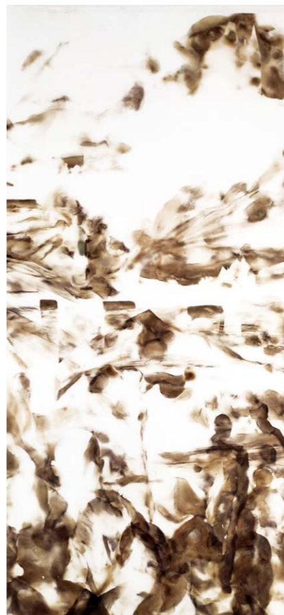
ΑΓΝΩΣΤΟ ΑΥΡΙΟ II Φωτιά σε χαρτί 80x39 εκ. 2022