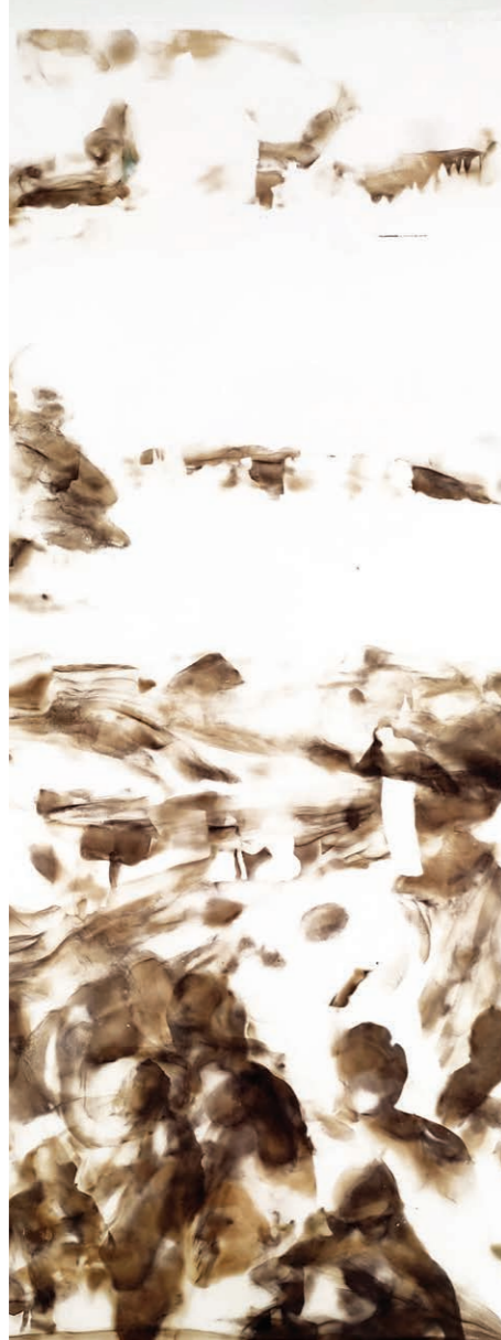
ΑΓΝΩΣΤΟ ΑΥΡΙΟ ΙΙΙΙ Φωτιά σε χαρτί 79x31 εκ. 2022