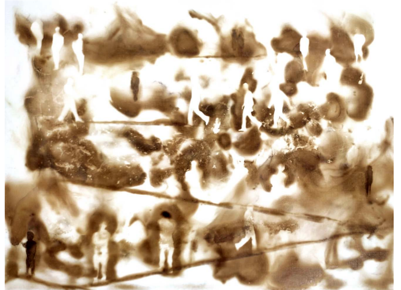
ΔΙΑΔΡΟΜΕΣ III Φωτιά σε χαρτί 43x33 εκ. 2023