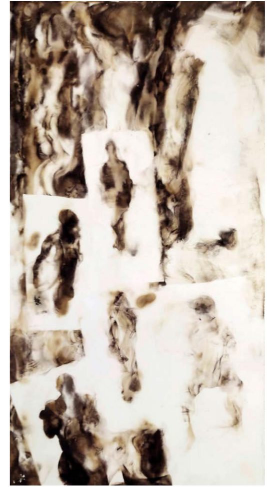
ΚΟΜΜΑΤΙΑ ΤΟΥ ΧΘΕΣ Φωτιά σε χαρτί 52x28 εκ. 2021