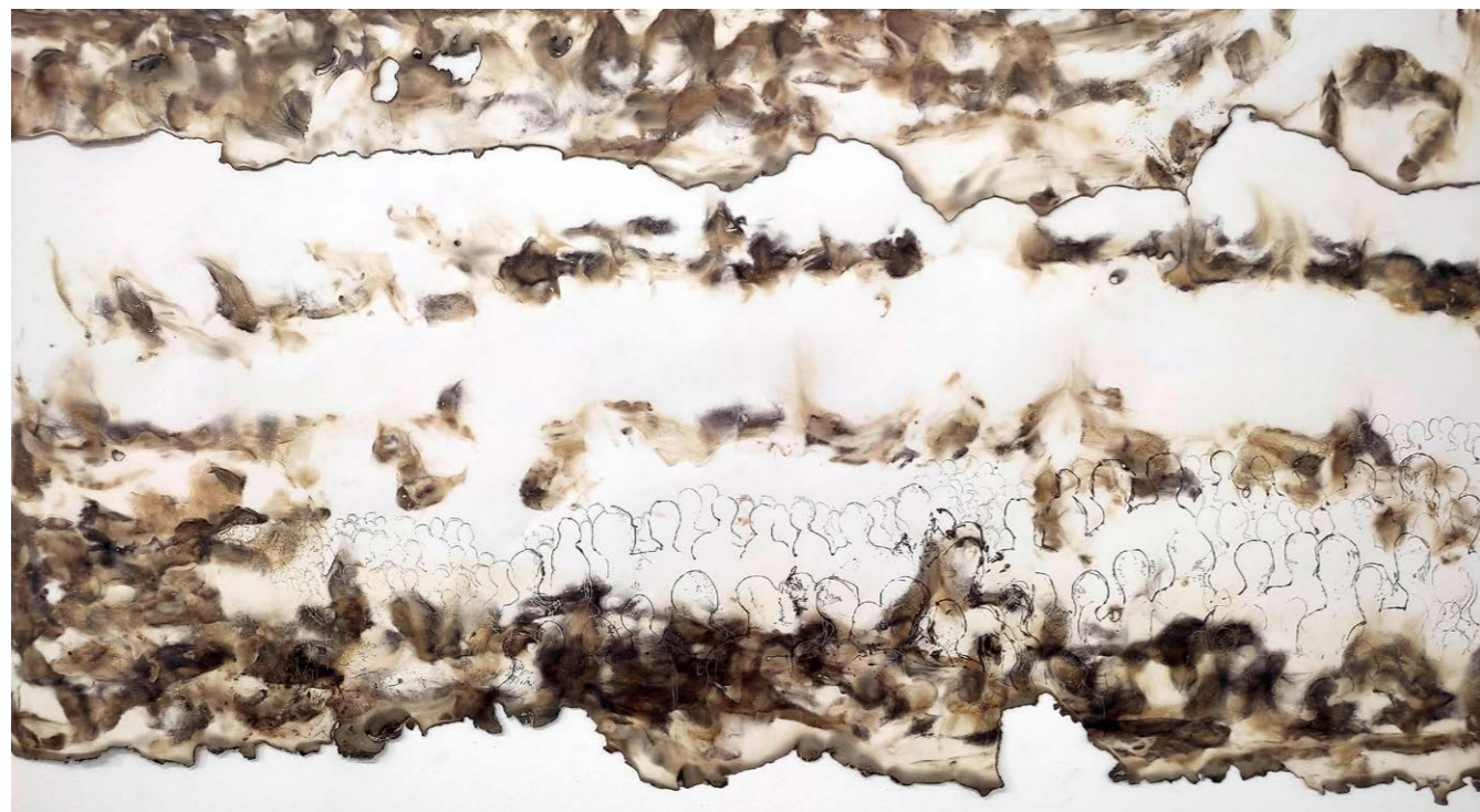
ΟΛΑ ΑΛΛΑΖΟΥΝ Φωτιά σε χαρτί 71x132 εκ. 2023