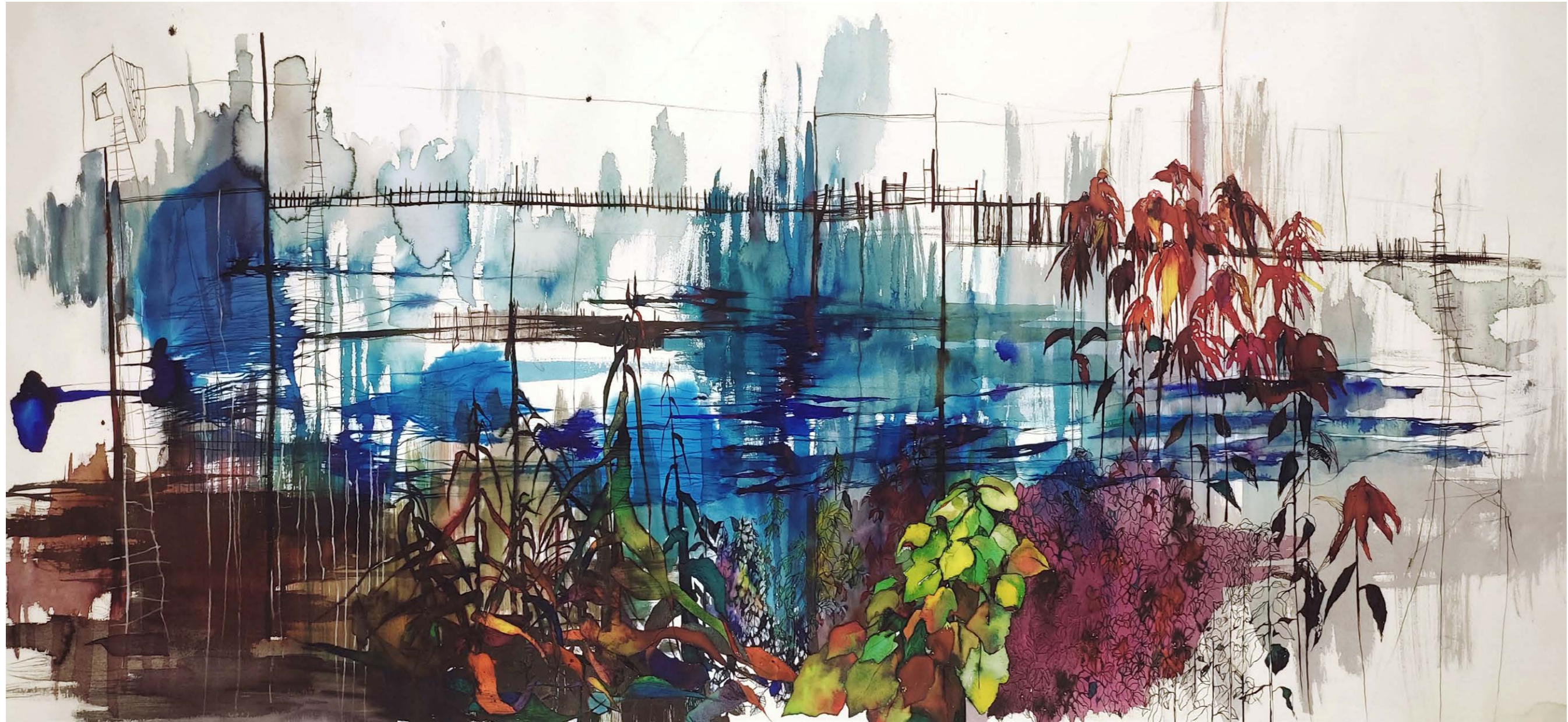
ΣΤΗ ΘΑΛΑΣΣΑ Ακουαρέλα, μελάνι, πενάκι 65x140 εκ. 2023