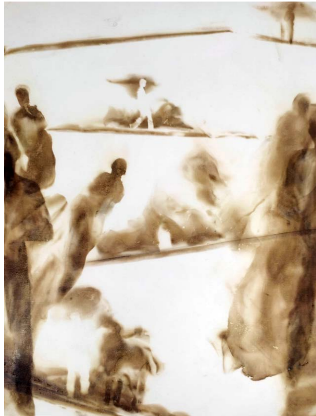
ΔΙΑΔΡΟΜΕΣ II Φωτιά σε χαρτί 43x33 εκ. 2023