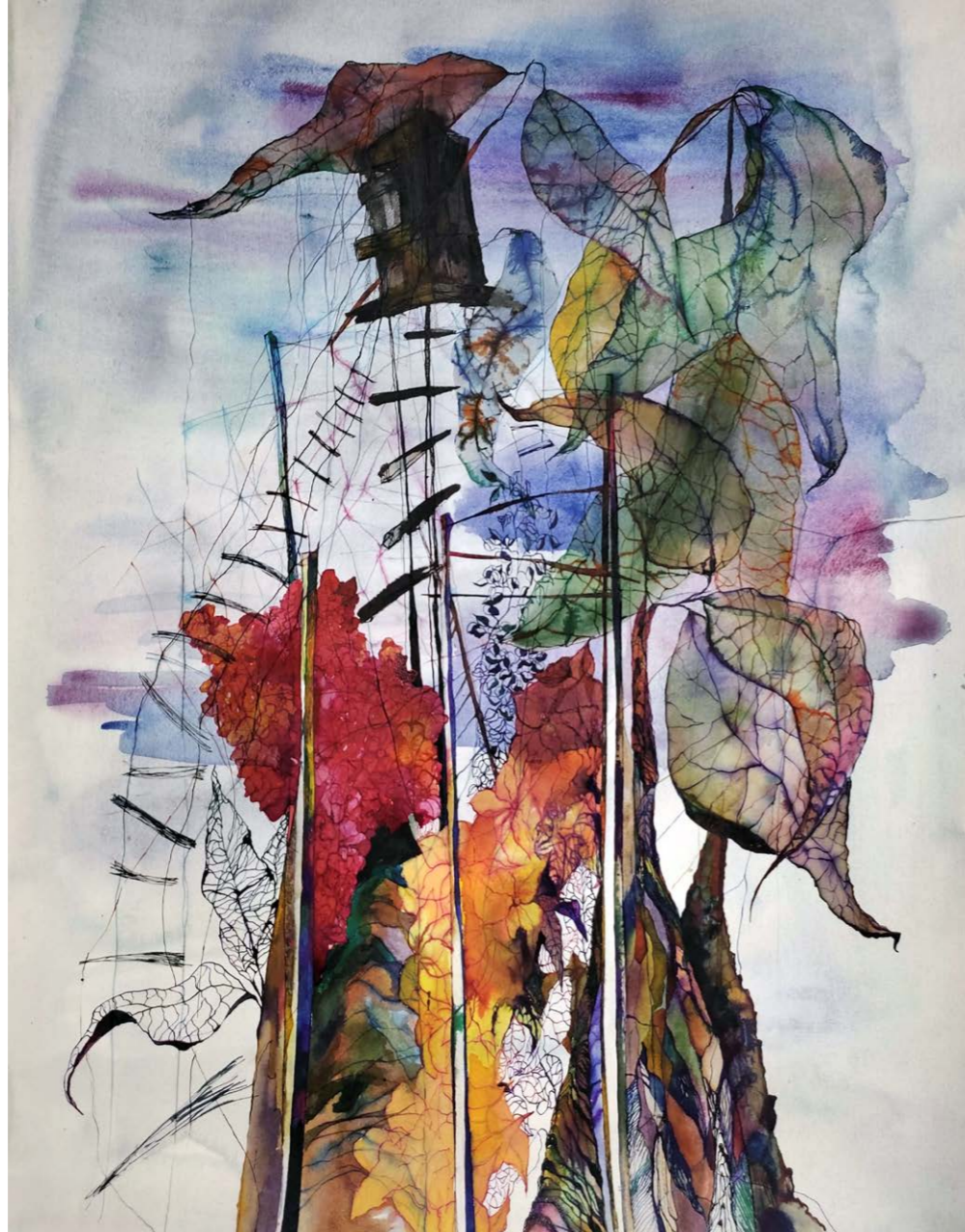
ΠΑΡΑΤΗΡΗΤΗΡΙΟ II Ακουαρέλα, μελάνι, πένακι 78x59 εκ. 2022