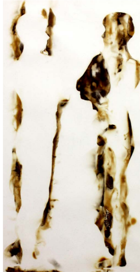
ΚΑΘΡΕΦΤΗΣ Φωτιά σε χαρτί 54x35 εκ. 2021