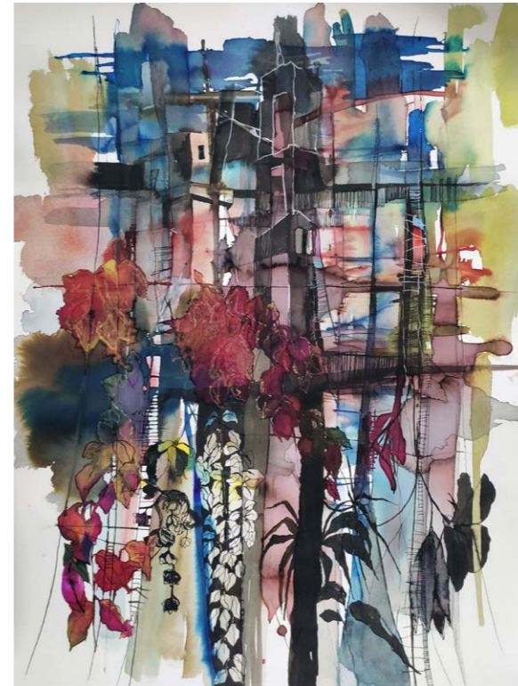
ΤΕΛΟΣ ΚΑΛΟΚΑΙΡΙΟΥ Ακουαρέλα, μελάνι, πενάκι 67x54 εκ. 2023